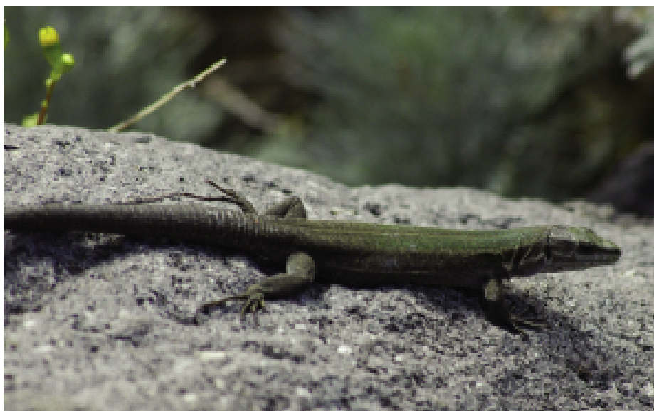
Fig. 10 — Un maschio adulto di Podarcis raffonei ssp. alvearioi della popolazione di Scoglio Faraglione.