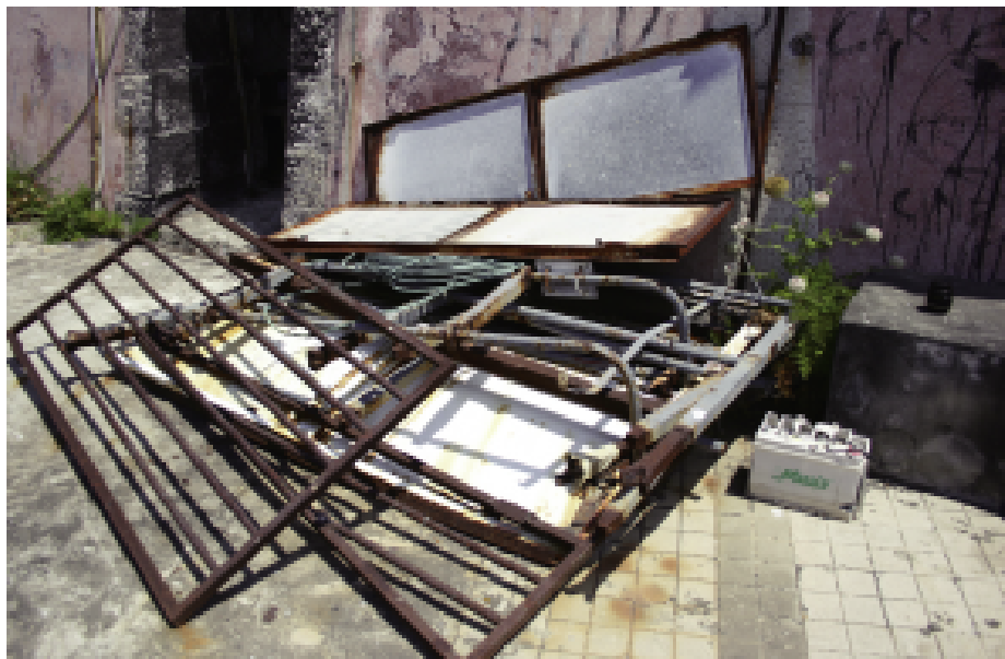
Fig. 11 — Rifiuti ferrosi e batterie scariche abbandonate in prossimità del fanale di Strombolicchio.

Infine, Scoglio Faraglione, esterno al perimetro della R.N.O. "Le Montagne delle Felci e dei Porri" e a quello dei Siti Natura 2000 contigui, risulta ancora oggi non sottoposto ad alcun vincolo, sebbene tale anomalia sia stata ripetutamente segnalata in letteratura (CORTI et al. , 1998; LO CASCIO & NAVARRA, 2003; LO CASCIO & PASTA, 2004; LO CASCIO, 2006) ed evidenziata nell'ambito dello "Studio dell'erpetofauna della R.N.O. Le Montagne delle Felci e dei Porri e di altre aree dell'Isola di Salina", finanziato con D.P. n. 167 del 30/12/2004 dalla Provincia Regionale di Messina, che gestisce l'area protetta dell'isola vicina. A sei anni di distanza dal completamento di quest'ultimo, il permanere di tale situazione appare quantomeno singolare, se si considera che nei materiali tecnico-divulgativi ed illustrativi prodotti dall'ente gestore viene fatto ampio riferimento all'importanza naturalistica del sito e addirittura che la locale popolazione di Podarcis raffonei viene annoverata tra le principali emergenze faunistiche della riserva.