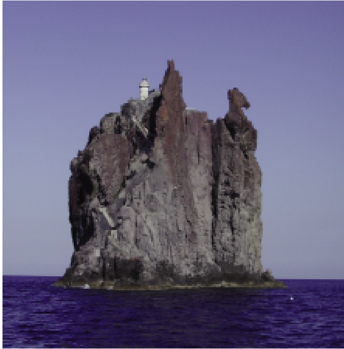
Fig. 4 — L'aspetto attuale dell'isolotto; si noti l'assenza di un'ampia porzione sommitale, demolita durante i lavori di costruzione del fanale tra la fine del XIX e l'inizio del XX secolo.

specie della lucertola campestre ( Lacerta sicula ssp. raffonei ); attualmente viene invece riferita alla forma nominale della lucertola delle Eolie (RAZZETTI et al. , 2006), ben differenziata dalle restanti popolazioni sotto il profilo morfologico, per le maggiori dimensioni corporee e per gli arti anteriori relativamente corti, e genetico, per la presenza dell'allele esclusivo Pgm-2 105 (CAPULA, 2006). La sua consistenza è stata stimata in un primo tempo come pari a 20-60 individui (CAPULA & LUISELLI, 1997; CAPULA et al. , 2002); recenti indagini, effettuate con metodi standardizzati, forniscono invece dati più confortanti, registrando una densità di 3000-4000 ind./ha e una consistenza di 500-700 individui (CAPULA & LO CASCIO, in stampa).