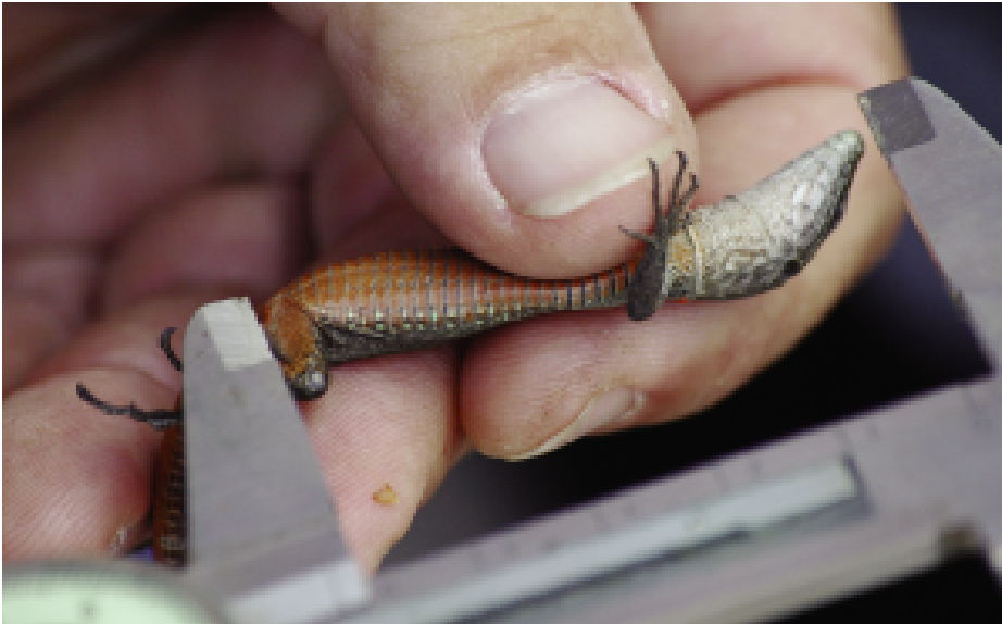
Fig. 8 — Lo stesso esemplare durante un rilevamento biometrico; si noti il colore rossastro delle parti ventrali.