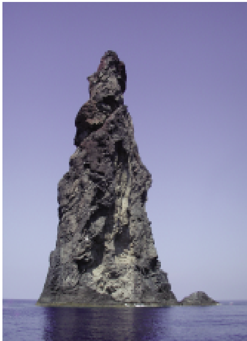
Fig. 6 — La Canna, di fronte alla costa occidentale dell'Isola di Filicudi.

La lucertola delle Eolie è stata oggetto di ricerche a carattere biologico ed ecologico a partire dalla seconda metà degli anni Novanta, a seguito della sua rivalutazione come specie biologica distinta e parallelamente a una graduale definizione del suo status conservazionistico. Un'ampia sintesi delle conoscenze disponibili è riportata nel capitolo relativo alla specie, in pubblicazione nel volume della collana "Fauna d'Italia" dedicato ai Rettili (CAPULA & LO CASCIO, in stampa); nel presente contributo, si evidenzia il diverso grado di approfondimento delle indagini a carattere biologico ed ecologico che hanno preso in esame le singole popolazioni.