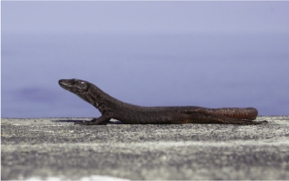
Fig. 7 — Una femmina adulta della popolazione di Strombolicchio, riferita alla sottospecie nominale di Podarcis raffonei .