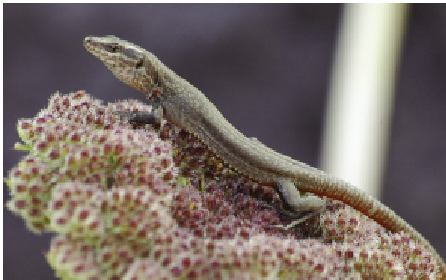
Fig. 9 — Un giovane di Strombolicchio in caccia su un'infiorescenza di Daucus carota .