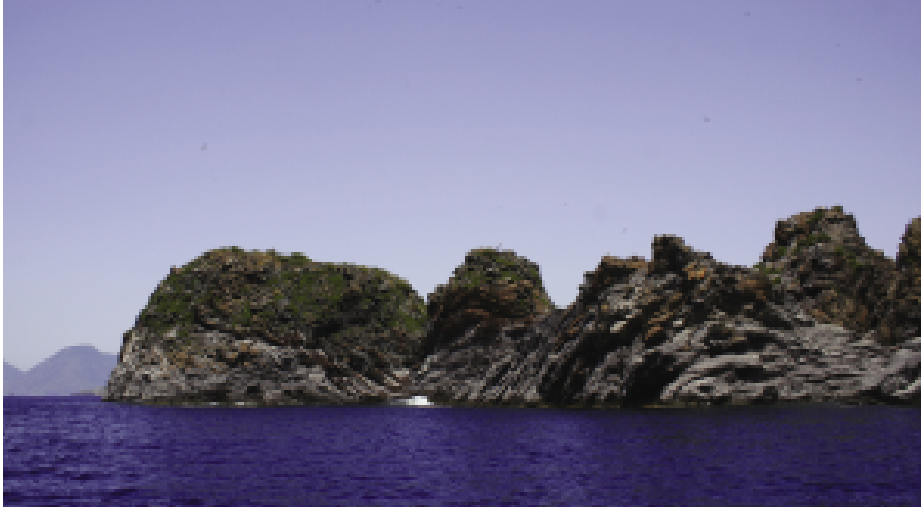
Fig. 2 — Il promontorio di Capo Grosso, nella costa nord-occidentale dell'Isola di Vulcano.