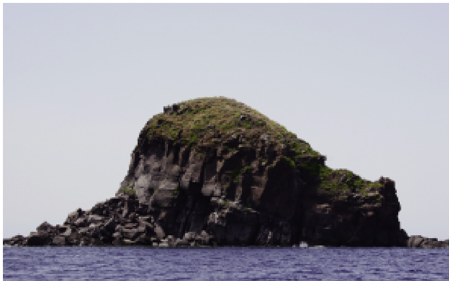
Fig. 5 — Scoglio Faraglione, al centro della baia di Pollara nella costa occidentale dell'Isola di Salina.

Scoperta casualmente dal gruppo di alpinisti che per primo ha effettuato la scalata del faraglione (BATTINESCHI et al. , 1973), la presenza di lucertole su La Canna è rimasta nota agli studiosi per alcuni anni senza che potesse