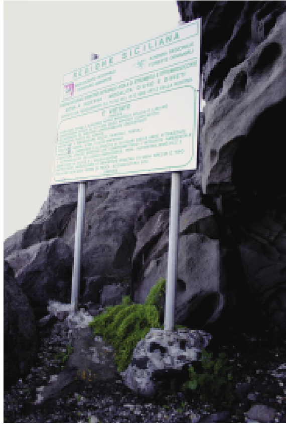
Fig. 12 — Il tabellone informativo dell'Ente gestore della Riserva Naturale Integrale di Strombolicchio; si noti la collocazione di uno dei pali di sostegno, cementato in prossimità di un individuo della rarissima Bassia saxicola , specie prioritaria in allegato alla Direttiva "Habitat".