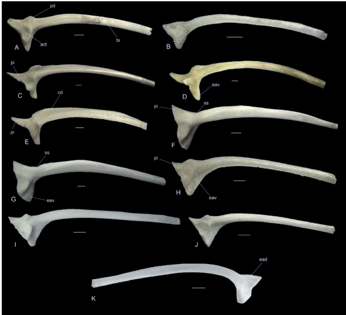
Fig. 1 — Ilei destri in vista laterale di Alytes obstetricans (A), Bombina variegata (B), Discoglossus montalentii (C), Discoglossus pictus (D), Discoglossus sardus (E), Pelobates cultripes (F), Pelobates fuscus (G), Hyla intermedia (H), Hyla meridionalis (I), Hyla sarda (J). Ileo sinistro in vista laterale di Pelodytes punctatus (K), modificato da SANCHIZ et al. , 2002. Scala: 1 mm. Abbreviazioni: act: acetabolo; bi: braccio iliaco; cd: cresta dorsale; ead: espansione acetabolare dorsale; eav: espansione acetabolare ventrale; pi: processo ischiatico; pd: protuberanza dorsale; ss: solco spirale/ Right ilia of Alytes obstetricans (A), Bombina variegata (B), Discoglossus montalentii (C), Discoglossus pictus (D), Discoglossus sardus (E), Pelobates cultripes (F), Pelobates fuscus (G), Hyla intermedia (H), Hyla meridionalis (I), Hyla sarda (J) in lateral view. Left ilium of Pelodytes punctatus (K) in lateral view, modified from SANCHIZ et al. , 2002. Scale bar: 1 mm. Abbreviations: act: acetabulum; bi: ilial shaft; cd: dorsal crest; ead: dorsal acetabular expansion; eav: ventral acetabular expansion; pi: ischiatic process; pd: dorsal prominence; ss: spiral groove.