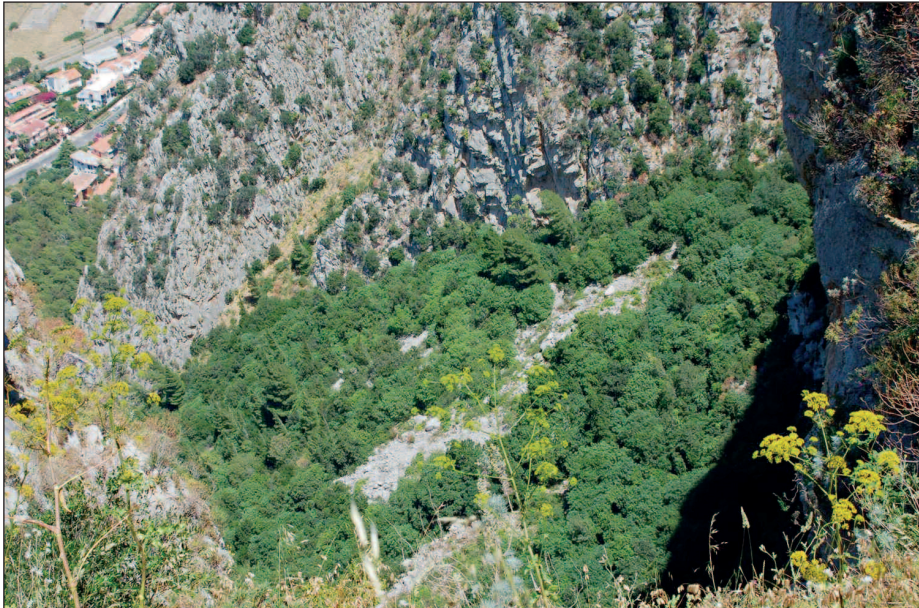
Fig. 5 — Foto scattata alcuni anni fa che mostra straordinari nuclei di vegetazione probabilmente unici superstiti della costa settentrionale della Sicilia. — The photo taken a few years ago shows extraordinary vegetation spots, probably the only survivors of the northern coast of Sicily.

inutile e quelle piante furono distrutte, solo dalla parte occidentale, negli appicchi della Real Favorita, in punti inaccessibili anche alle capre, vegeta qualche raro cespuglio di elce”. Lo stesso autore scrive: “Per concludere: il Monte Pellegrino nei tempi storici, dagli arabi e noi, è stato sempre adibito per libero pascolo pubblico e privato di bestiame, è pertanto non vi potè mai vegetare bosco di sorta alcuna”. In definitiva siamo di fronte ad un esempio di distruzione molto antica e continuata della vegetazione forestale, ma ciò nonostante la vegetazione di Monte Pellegrino è importante con riferimento soprattutto alla vegetazione rupicola (GIANGUZZI et al. , 1996) ed anche per i lembi di vegetazione forestale che rimangono dove si hanno anche manifestazioni biologiche peculiari come la rifiorenza del leccio dovuto al particolare microclima (LA MANTIA et al. , 2003) (Fig. 5). Questi lembi sono rimasti relativamente indisturbati, sebbene in qualche caso interessati da incendi (cfr. LIVRERI CONSOLE, 2002) questi ultimi però hanno interessato recentemente (giugno 2016) i rimboschimenti con effetti importanti. A differenza di quello che è accaduto in altre aree dei monti di Palermo, dove gli incendi hanno innescato delle dinamiche “positive” (MAGGIORE et al. , 2005), gli effetti su Monte Pellegrino sono decisamente negativi per la stabilità di queste fitocenosi.