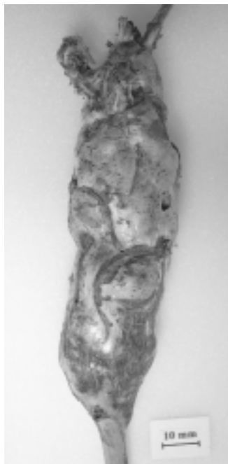
Fig. 3 — Galla di T. phoenixopodos .

Materiale esaminato. — Sicilia, Catania, Monte Etna: Mascalucia, Massannunziata, Bosco di Monte Ciraulo, m 500 s.l.m., 6 esemplari ottenuti da galla il 15.II.2003 (G. F. Turrisi leg.); Monte Etna: Pedara, m 600 s.l.m., 3 esemplari ottenuti da galle il 2.V.2001 (S. Arcidiacono leg.); Monte Etna: Maletto, contrada Fontanamurata, m 1000 s.l.m., numerose galle prelevate il 29.VI.2003 (G. F. Turrisi leg.).