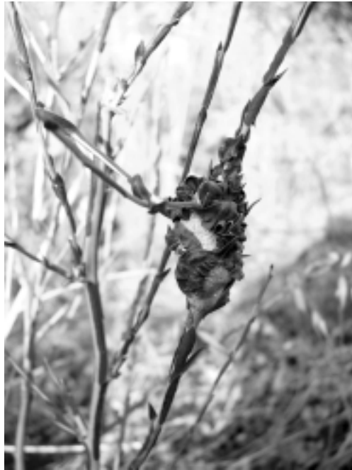
Fig. 2 — Galla di T. phoenixopodos in natura.

Timaspis phoenixopodos , DE STEFANI PEREZ, 1912: 63 (Sicilia: contrada Favare, versante orientale delle Madonie).