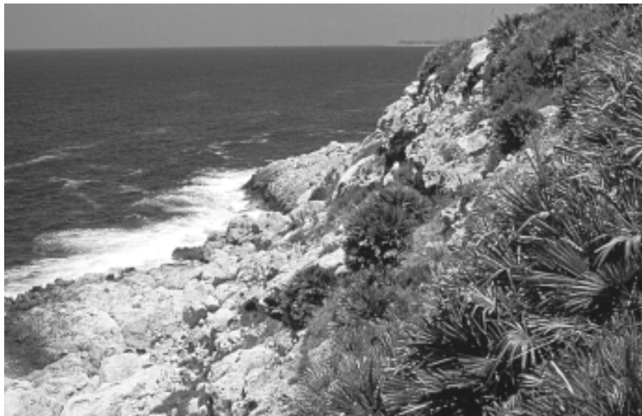
Foto 4 — Aspetti di vegetazione alofitica e di macchia a Palma nana lungo la fascia costiera.