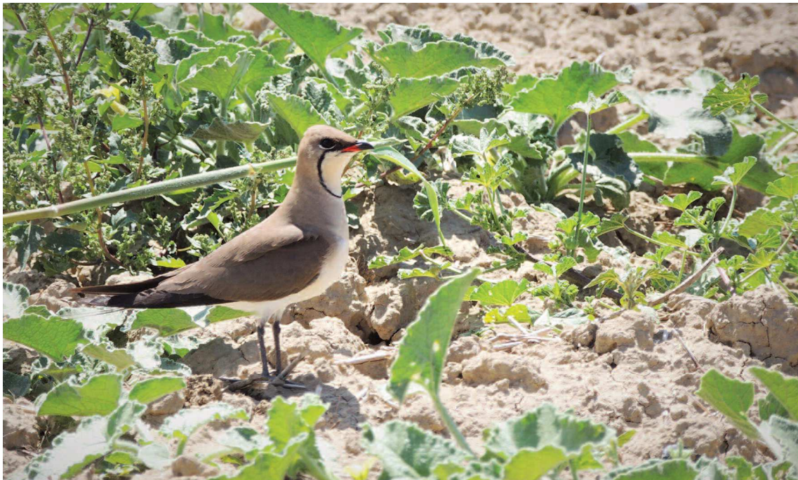
Fig. 2 — Individuo adulto di Pernice di mare sul tipico suolo con aratura conservativa e vegetazione sparsa (Foto: R. Terranova, 25.IV.2018)

Queste osservazioni hanno permesso nel 2018 di avviare una forma di collaborazione con gli agricoltori locali proprietari dei fondi agricoli in cui nidifica la colonia B raggiungendo un obiettivo: spostare di 22 giorni il periodo di aratura del terreno e salvare 25-30 pulcini di Pernice di mare. Questo rapporto di collaborazione è già stato migliorato ulteriormente nella stagione riproduttiva 2019, con l'individuazione di un terreno in cui è stata appositamente eseguita un'aratura conservativa, a cui sono stati aggiunti elementi di protezione quali una zona d'ombra con solchi, tegole e cassette in legno, chiazze di seminativo a perdere e pietraie con anfratti utilizzabili come rifugio. In considerazione del fatto che la specie gode di un pessimo stato di salute e la possibilità di aiuto delle realtà ambientaliste si traduce in azioni sicuramente importanti ma puntiformi, occorre avviare nell'immediato una serie di strategie a più ampio spettro.