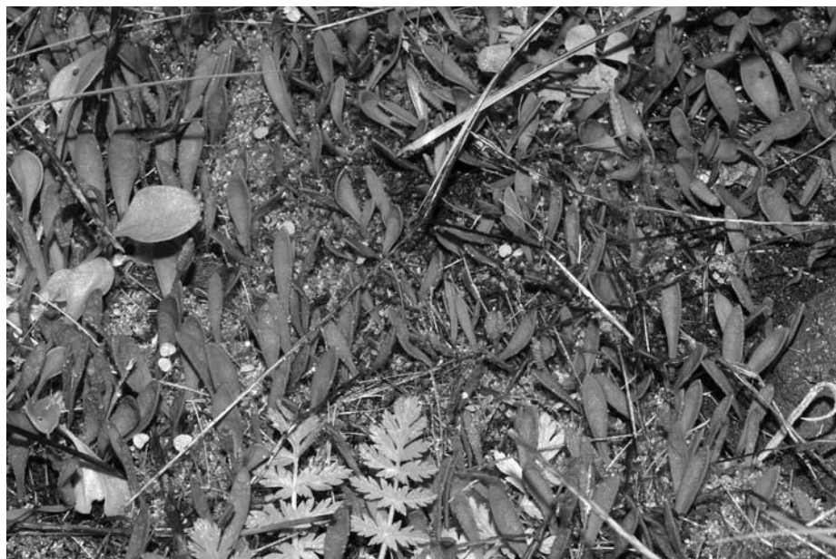
Fig. 2 — Popolamento di Ophioglossum lusitanicum (Isola di Vulcano, 4-5/11/2015,)