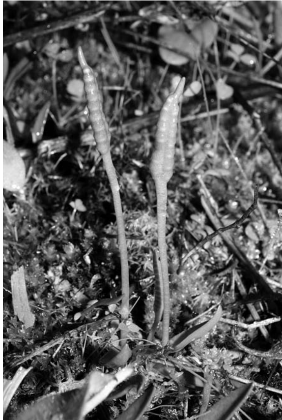
Fig. 1 — Ophioglossum lusitanicum (Isola di Vulcano, 4-5/11/2015)

Le conoscenze disponibili sulla distribuzione di Ophioglossum lusitanicum nel territorio siciliano appaiono piuttosto datate e necessiterebbero di un significativo aggiornamento attraverso verifiche di campo. I popolamenti noti sono distribuiti nelle aree costiere di tutta l'isola (in particolare, nei Peloritani) e nella zona pedemontana etnea. Per un quadro completo delle stazioni storiche o più recenti si rimanda alla checklist di GIARDINA et al. (2007), cui vanno aggiunte Niscemi nel Nisseno (AA.VV., 1998), Lago Arancio nell'Agrientino (MAR-