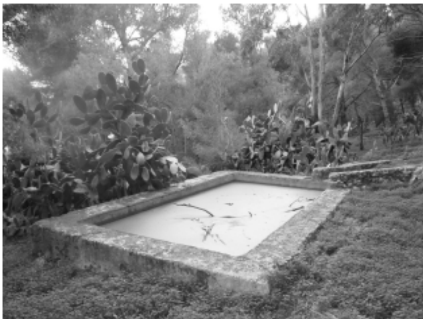
Fig. 3 — La vasca in cemento presso Pizzo Grattarola in data 29 ottobre 2010.

Nessuna specie del genere Lemna era stata in precedenza segnalata per