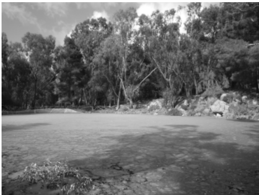
Fig. 1 — Il Gorgo di Santa Rosalia ricoperto da Lemna minuta Kunth (27 marzo 2010).